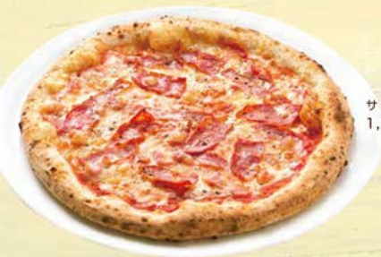
サラメミスト 1,373円(税込1,510円)