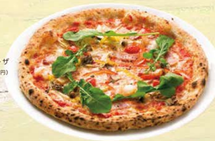
カプリチョーザ 1,473円(税込1,620円)