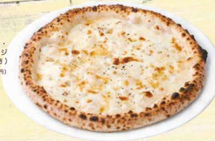
クアトロ・ フォルマッジ (ハチミツ付き) 1,473円(税込1,620円)