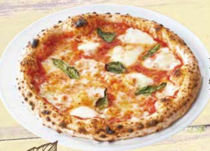
マルゲリータ 1,337円(税込1,470円) 増し増しチーズ 155円(税込170円)